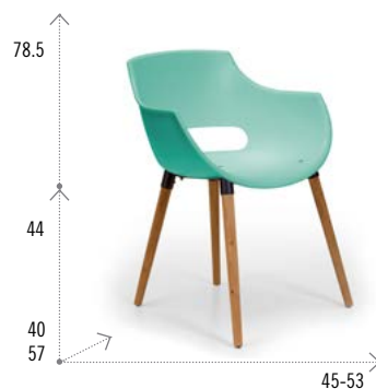
Modelo FRIDA WOOD