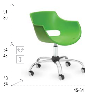
Modelo FRIDA NEUMÁTICA