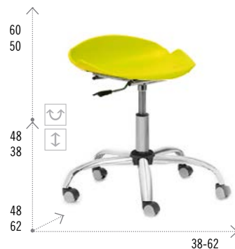
Modelo MILO NEUMÁTICO