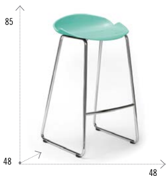
Modelo MILO TABURETE