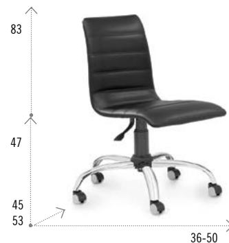
Modelo LYON NEUMÁTICA