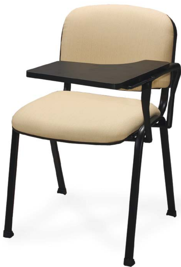
— ap pupitre