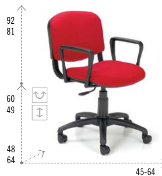
Modelo AP 60