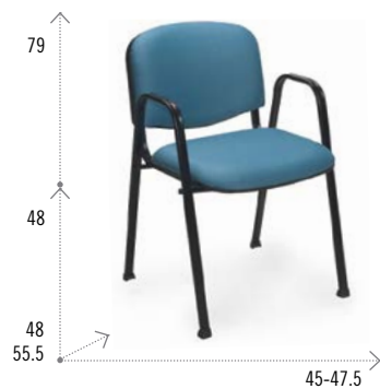
Modelo AP 50