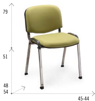
Modelo AP 40