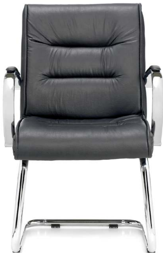
— trento trineo