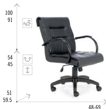
Modelo TRENTO 500