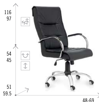
Modelo TRENTO 501