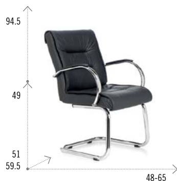
Modelo TRENTO TRINEO