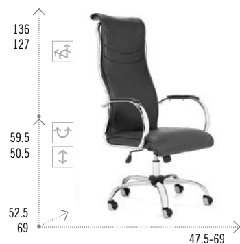
Modelo JAZZ 901