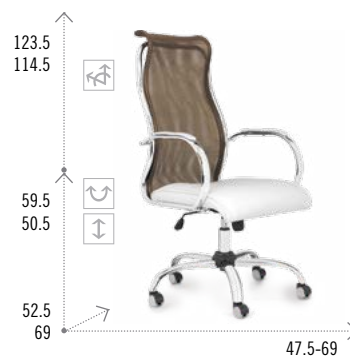
Modelo JAZZ 900 AIR BACK