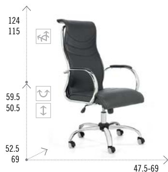
Modelo JAZZ 900