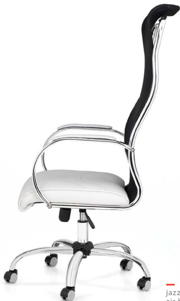
jazz 901 air back