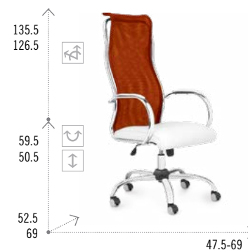
Modelo JAZZ 901 AIR BACK