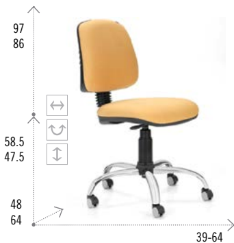
Modelo RUDY 200