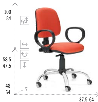
Modelo RUDY 200