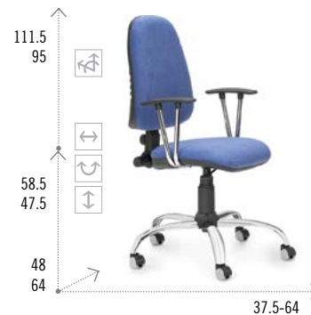
Modelo RUDY 210